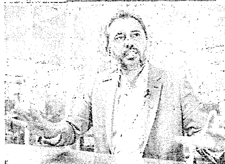
ELMANO terá mais peso em 2024 do que Camilo tinha em 2016 e 2020