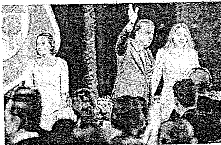
Camilo Santana ao se despedir do Palácio da Abolição no dia em que passou o cargo para Izolda

QUARTA-FEIRA | FORTALEZA - CEARÁ | 19 DE JULHO DE 2022