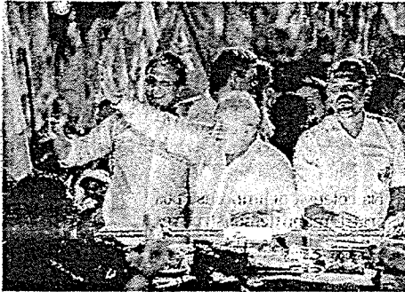
CAMILO, Lula e Etmano em ato pelo Centro de Fortaleza na sexta-feira